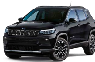
Solid black - 601