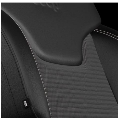
Black Cloth - Vinyl with Diesel Grey Stitching – 020 Standard for ALTITUDE