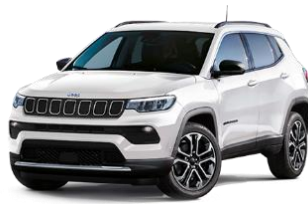
Alpine white - 296