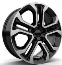
18" Alloy Wheel Diamond – 3DM Standard for ALTITUDE