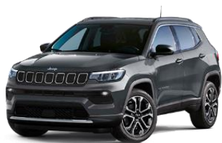
Graphite Grey - 679