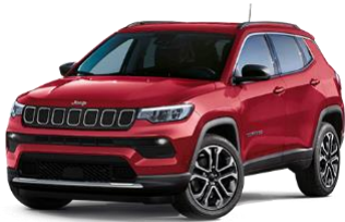
Colorado red (Std ALTITUDE) - 176