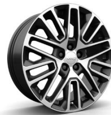
19" Alloy Wheels -3DP Standard for SUMMIT