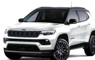
Alpine White with Black Roof 317