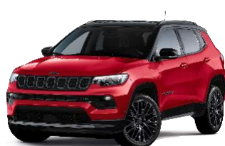
Colorado Red with Black Roof (Std for SUMMIT) - 686