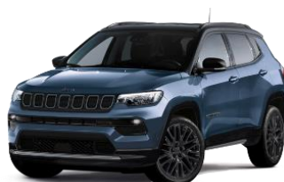
Blue Shade with Black Roof 263