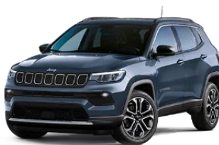
Blue Shade - 435