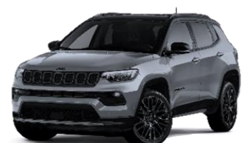
Graphite Grey with Black Roof 170